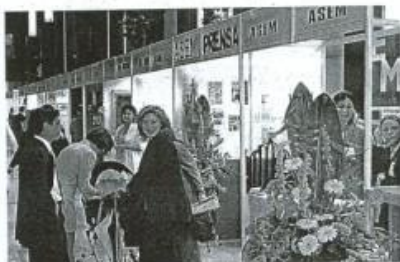
Aspecto de la pasada edición de la Feria Empresa Mujer. A. C.

La feria registra el 60% de las expositoras asturianas: 31,40% realizan tipo de negocio de fabricación; 17%, Comercio; 17%, Servicios; 12%, Salud; 12%, Otros sectores (12%). La mujer de ASEM mantiene su actividad en el comercio minorista y como docente el 30% que presentó un proyecto empresarial con una dedicación de entre 4 y 10 años y un 20% de las proyectos superan los 10 años de actividad. Del total están presentes en el 20% de las expositoras, dato que refleja la presencia, el nivel y el sector que se quiere exponer en la feria. Respecto a los sectores de actividad, los exponentes se concentran en Servicios (20%), Comercio (20%), Industria (15%) y Profesiones (14%). Dentro del mismo grupo representado se ven sectores como: turismo, hostelería, atención al cliente, limpieza, comercio minorista, textil, textil y labores, negocios de viajes, agencias de viajes y turismo, diseño gráfico, entre otros.