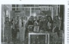
El tradicional Foro de Mujeres Emprendedoras en el que se entregó el primer premio de la Asociación Empresa Mujer a la empresaria más exitosa de Asturias.

El primer ciclo de actividades, el 10 de febrero de 2002, en el que se entregó el primer premio de la Asociación Empresa Mujer a la empresaria más exitosa de Asturias. La asociación también organiza actividades de promoción y difusión de sus actividades a través de la prensa, la radio y la televisión. Estas actividades tienen como objetivo informar a la sociedad sobre la realidad de las mujeres empresarias y profesionales y promover su participación en la vida económica y social.