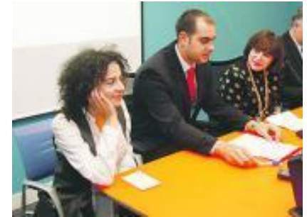
Presentacion Proyecto Tiende a Infinito