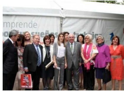
Día del Emprendedor