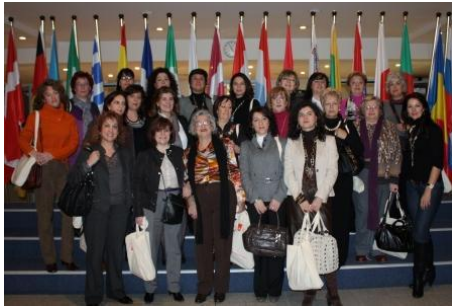
Viaje a Bruselas