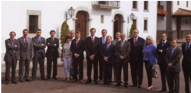
Comité de la Cámara de Comercio