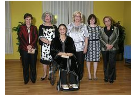
ASEM de ORO Premiadas