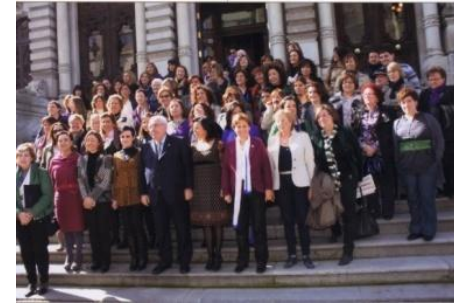
Consejo Asesor de la Mujer del Principado de Asturias