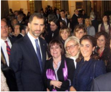
Premios Principe de Asturias