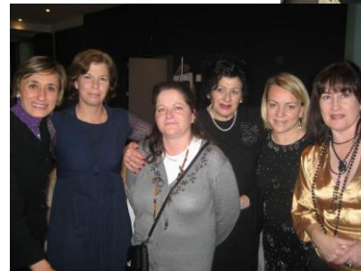
Cena de Navidad 21 de Diciembre