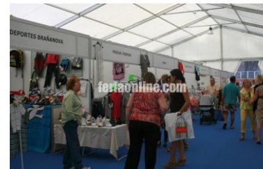
Feria de Candás