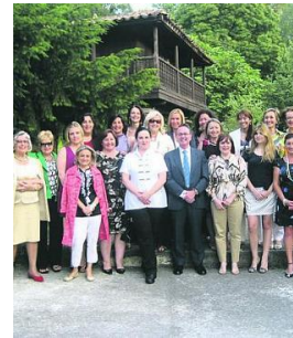
Cena Junio Langreo